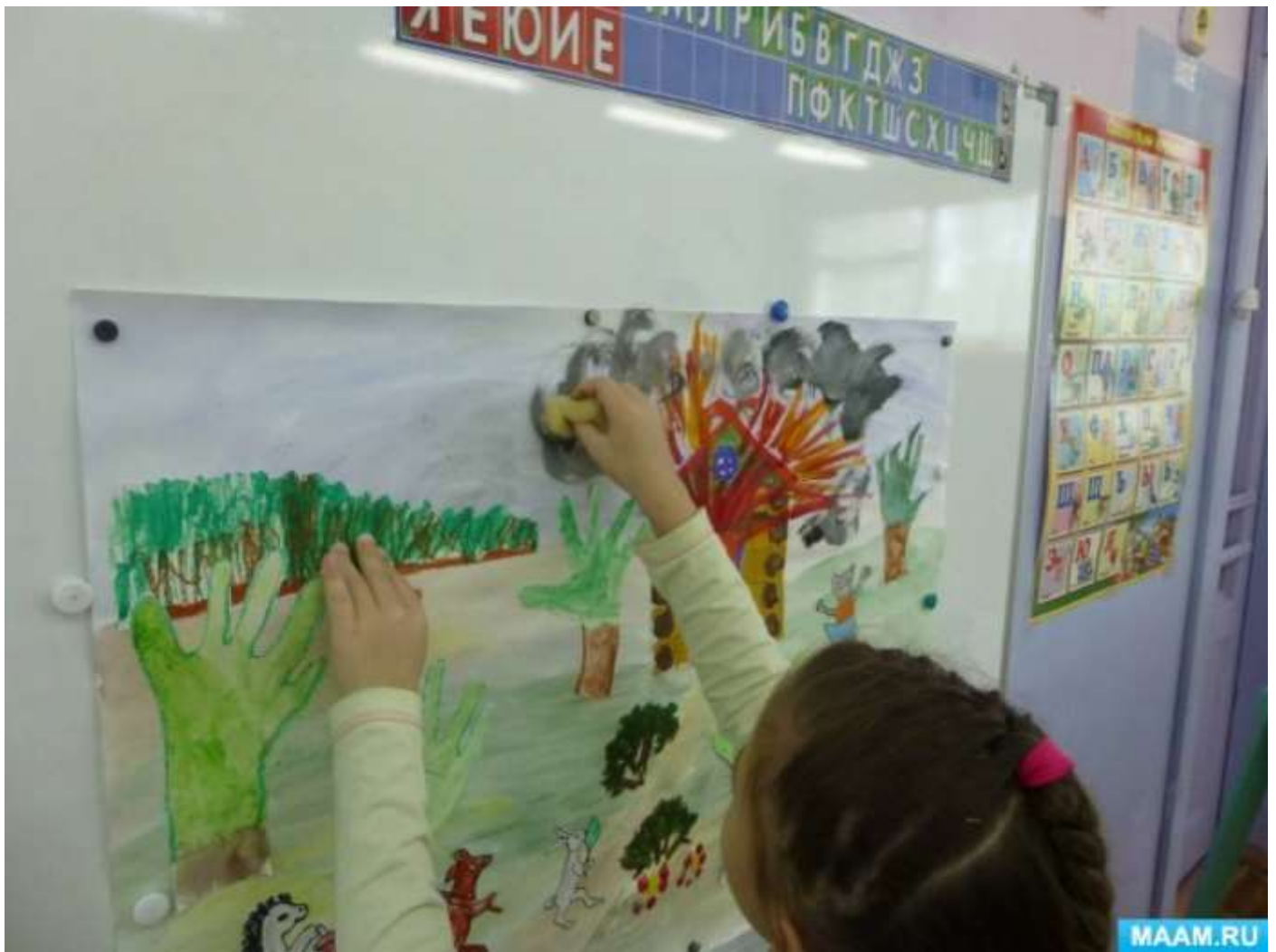
С помощью поролоновой губки нарисовали дым