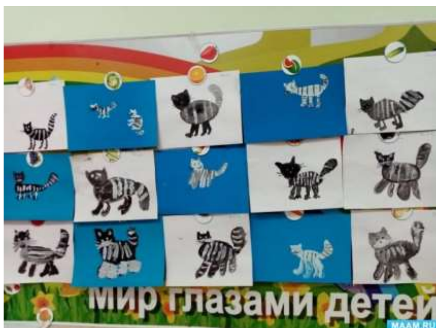
План поэтапных мероприятий

Рисование «Усатый полосатый» по произведениям С.Маршака