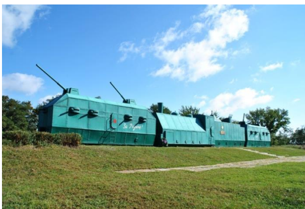
Зда – зда – зда – по рельсам едут ... (бронепоезда).