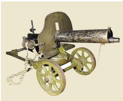
Ёт – ёт – ёт – стрекочет ... ( пулемёт ).