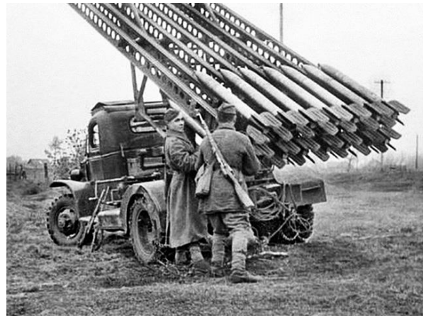
Ши – ши – ши – громко бьют ... ( Катюши ).