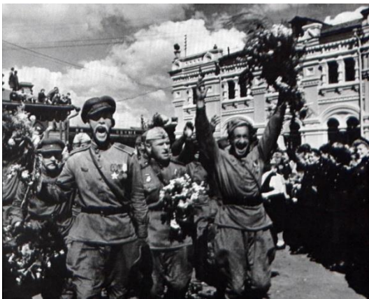
Ра – ра – ра – народ кричит ... (Ура!)