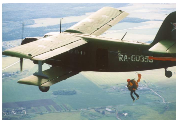
Исты – исты – исты – спускаются ... (парашютисты).