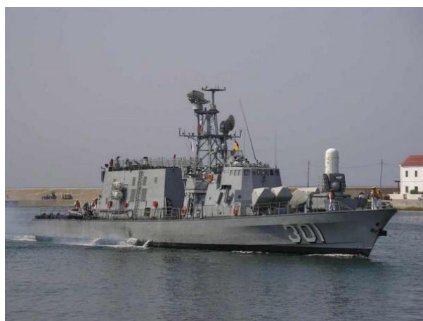
Ли – ли – ли – а это военные ... (корабли).