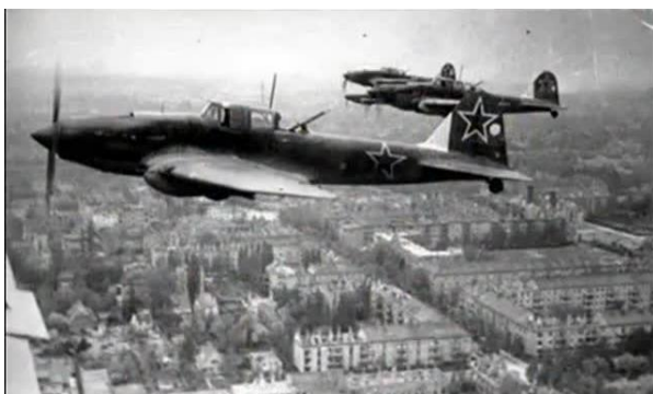
Ёты – ёты – ёты – в небе ... (самолёты).