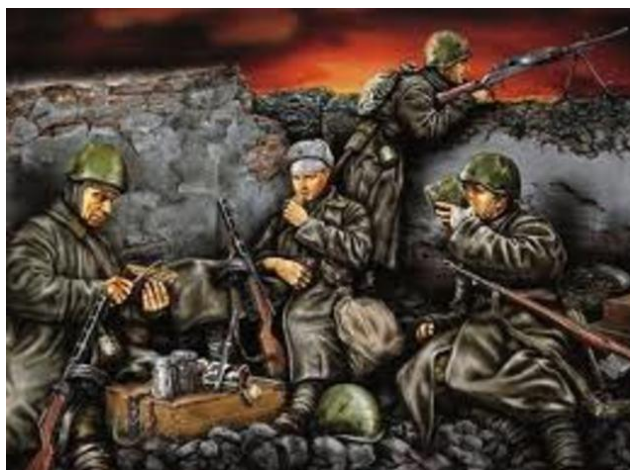
Цы – цы – цы – смелые ... (бойцы).