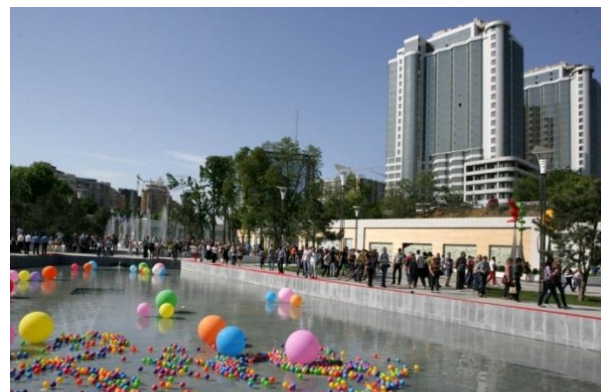
Ир – ир – ир – нет войне, нам нужен ... (мир) .