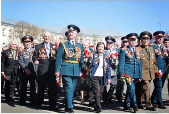
Аны – аны – аны – шагают ... (ветераны) .