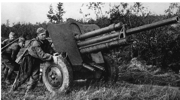
Исты – исты – исты – отважные ... (артиллеристы). Автор: Ермолина Л.Н.