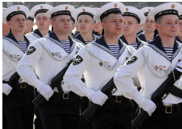
Ки – ки – ки – воюют наши ... (моряки).