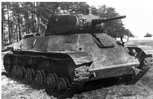
Ки – ки – ки – в бой идут ... (танки).