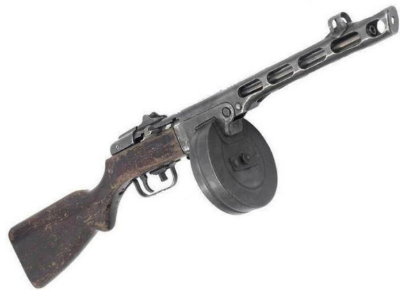
Ат – ат – ат – стреляет ... ( автомат ).